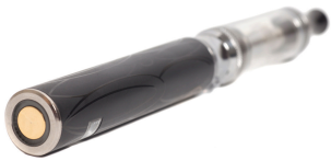
Pluma de Vapor

Conozca sus productos de CIGARRILLOS ELECTRÓNICOS.