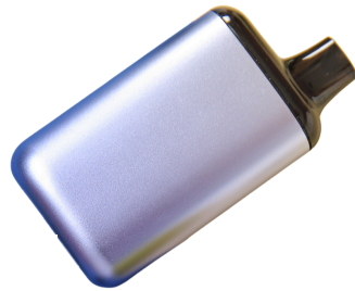
Cartucho Mod de Vapeo