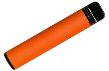
Cartucho de Vapeo